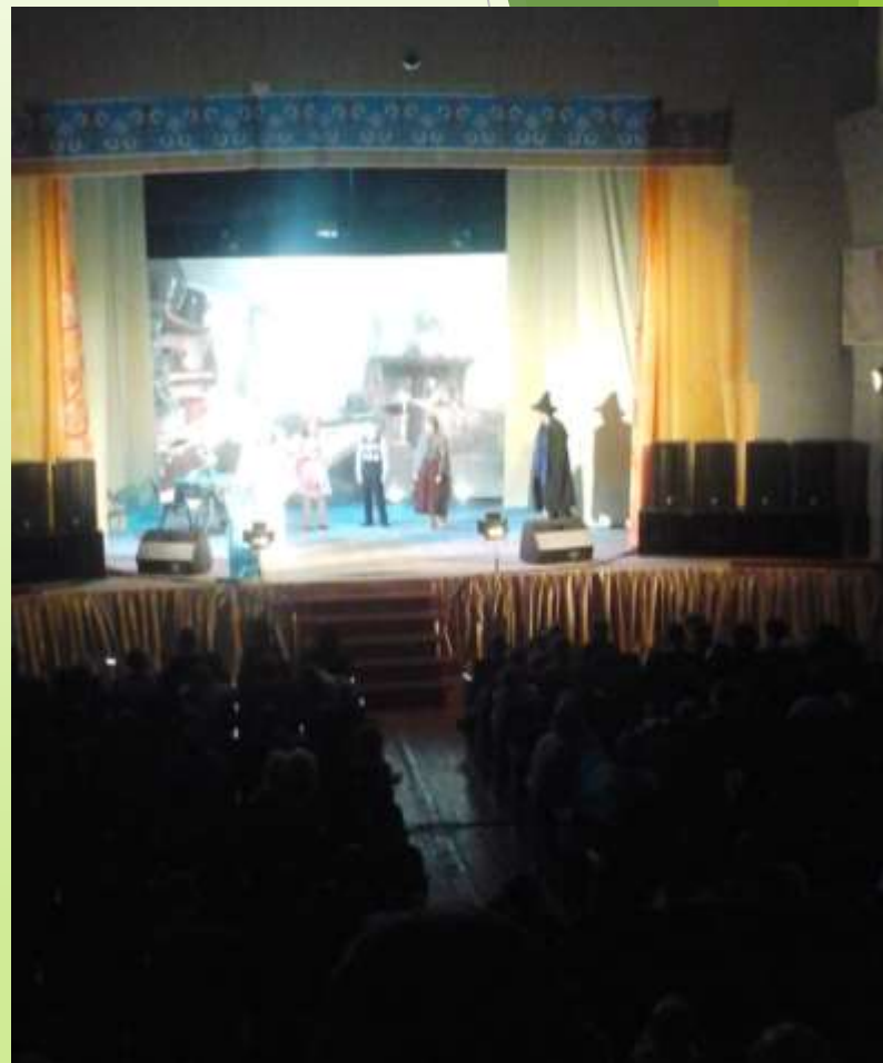
Спектакль «Снежная Королева»